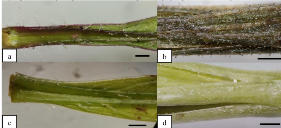
Gambar 3. Variasi ciri trikoma pada R. Simplex , yaitu tangkai daun muda bertrikoma rapat (a), daun kelopak bunga dengan trikoma berkelenjar (b), tangkai daun muda bertrikoma jarang (c), daun kelopak bunga tanpa trikoma berkelenjar (d). Skala bar= 1 mm

Pengamatan mikromorfologi menunjukkan adanya variasi tipe trikoma pada R. simplex yang diperoleh dari lapangan. Spesimen yang tangkai daun mudanya yang berambut rapat memiliki daun kelopak bunga yang berkelenjar (Gambar 3 a-b). Sementara itu, spesimen dengan tangkai daun muda yang berambut jarang memiliki daun kelopak bunga yang tidak berkelenjar (Gambar 3 c-d).