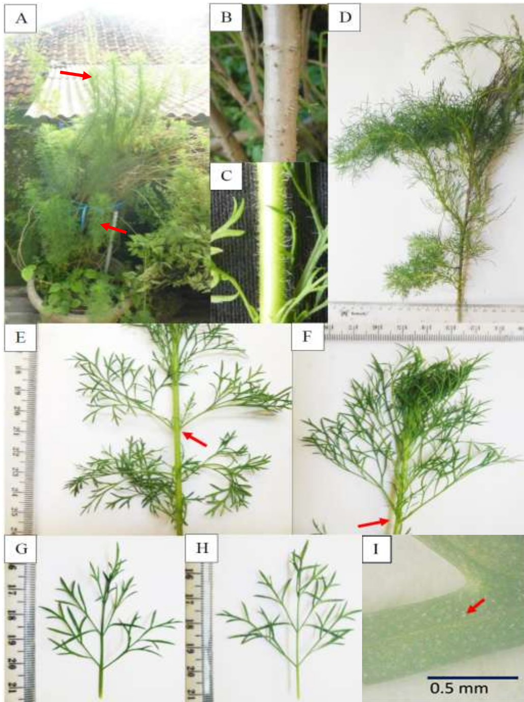
Gambar 1. Ciri vegetatif Eupatorium capillifolium (Lam.) Small ex Porter & Britton. A. perawakan; B. permukaan batang berwarna coklat kelabu; C. permukaan ranting yang berambut memasai; D. bagian ranting; E. daun bagian bawah yang tersusun berhadapan (panah); F. daun bagian atas yang tersusun berseling (panah); G. sisi adaksial daun; H. sisi abaksial daun; I. kelenjar di permukaan daun yang berburikan (panah).

nama daerah bungo cina di Sumatera Barat (Tjitrosoedirdjo, 2000).