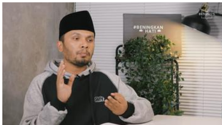
Foto 12. Gestur Tangan Ustadz Hanan Attaki yang Terbuka sebagai Tanda Empati

Profil gestural Ustadz Hanan Attaki berbeda fundamental dari Habib Ja'far: gesturnya cenderung terbuka, ringan, dan empatik—bukan ekspresif dan dramatis. Momen paling signifikan adalah saat ia menyentuh dadanya sambil mengucapkan 'perasaan kita yang terluka' dalam 'Obat untuk Menjawab Setiap Masalah' (menit 00:04). Gerakan tunggal yang kecil ini melakukan pekerjaan retorik yang besar: ia mengubah deskripsi verbal tentang rasa sakit emosional menjadi pengalaman yang terasa nyata dan hadir secara fisik. Sentuhan dada adalah bahasa tubuh universal untuk empati dan ketulusan—audiens melihat bahwa pendakwah merasakan apa yang mereka rasakan (Sulistyarini & Zainal, 2018).