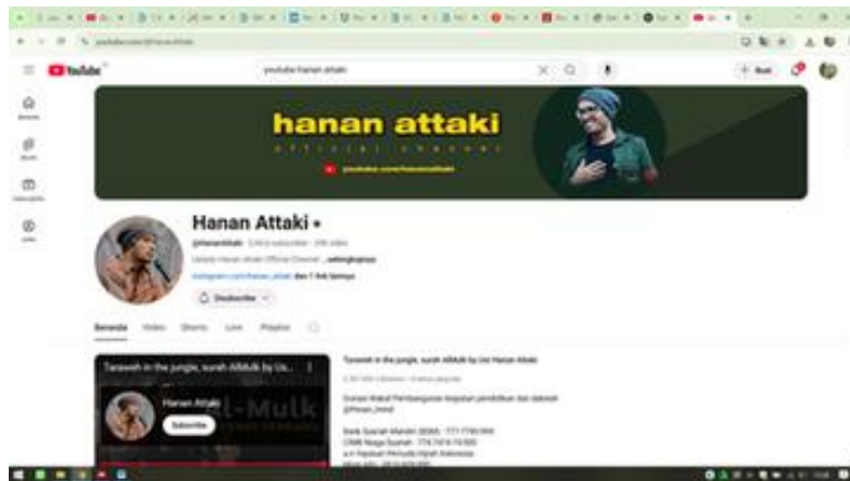
Foto 4. Tampilan Channel YouTube 'Hanan Attaki' dengan 2,94 Juta Subscriber

Kedua pendakwah ini memiliki kesamaan dalam hal: (a) menargetkan generasi muda sebagai audiens primer; (b) menggunakan medium YouTube sebagai platform dakwah utama; (c) menghindari gaya ceramah formal yang kaku; (d) membangun persona publik yang dekat dan tidak eksklusif; dan (e) meraih tingkat keterlibatan audiens yang tinggi sebagaimana tercermin dalam jumlah subscriber dan tayangan. Kesamaan-kesamaan ini menjadikan perbandingan gaya retorika keduanya semakin bermakna, karena perbedaan yang muncul di antara mereka bukan disebabkan oleh faktor kontekstual yang berbeda, melainkan oleh pilihan-pilihan retorik yang berbeda dalam kondisi yang relatif setara.