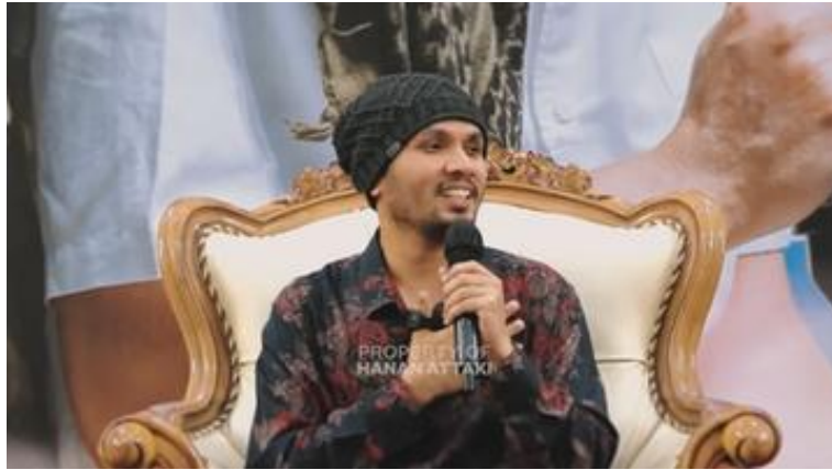
Foto 13. Ekspresi Hangat Ustadz Hanan Attaki Saat Menyisipkan Humor dalam Ceramah

Dalam 'Hikmah Dibalik Salat', Ustadz Hanan Attaki konsisten memegang Al-Qur'an dan sesekali membacanya sepanjang video. Kehadiran fisik Al-Qur'an ini bukan sekadar pernak-pernik; ia adalah properti retorik yang berfungsi pada tiga level: pada level ethos, Al-Qur'an menandakan bahwa setiap klaim yang disampaikan bersandar pada otoritas wahyu, bukan opini pribadi; pada level pathos, kehadiran teks suci mengundang rasa hormat dan keterbukaan hati pada audiens yang beriman; dan pada level logos, Al-Qur'an menjadi sumber utama bukti yang mendukung argumen-argumen yang disampaikan.