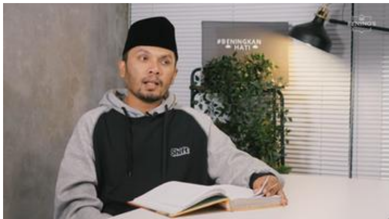
Foto 14. Ustadz Hanan Attaki Memegang Al-Qur'an sebagai Otoritas Visual dalam Dakwah

Dalam 'Hikmah Dibalik Salat', Ustadz Hanan Attaki konsisten memegang Al-Qur'an dan sesekali membacanya sepanjang video. Kehadiran fisik Al-Qur'an ini bukan sekadar pernak-pernik; ia adalah properti retorik yang berfungsi pada tiga level: pada level ethos, Al-Qur'an menandakan bahwa setiap klaim yang disampaikan bersandar pada otoritas wahyu, bukan opini pribadi; pada level pathos, kehadiran teks suci mengundang rasa hormat dan keterbukaan hati pada audiens yang beriman; dan pada level logos, Al-Qur'an menjadi sumber utama bukti yang mendukung argumen-argumen yang disampaikan.