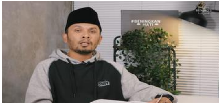
Foto 11. Ustadz Hanan Attaki Menyampaikan Pesan Dakwah dengan Bahasa Populer dan Emosional

Kalimat pembuka yang mendeskripsikan berbagai bentuk kelelahan emosional berfungsi sebagai cermin: audiens yang mengalami kondisi tersebut merasa langsung dikenali dan dipahami sebelum menerima pesan keislaman. Ini adalah pathos tingkat tinggi—rasa dikenali mendahului rasa diyakinkan, sehingga pertahanan psikologis audiens turun secara natural sebelum pesan inti disampaikan.