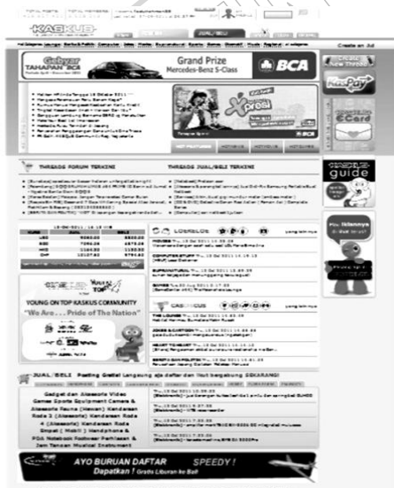
Gambar 2. ternyata telah banyak diminati oleh masyarakat Tampilan Kaskus

Kaskus, yang merupakan singkatan dari “kasak-kusuk” merupakan forum komunitas online Indonesia terbesar dan menduduki peringkat kedua situs yang paling banyak dikunjungi di Indonesia. 6 Sesuai dengan namanya “kasak-kusuk,” forum ini merupakan tempat sekitar 2,5 juta Kaskuser (sebutan bagi member Kaskus) untuk ber- kasak-kusuk melakukan banyak hal; diskusi, ngobrol , debat, jual beli dan lain-lain.