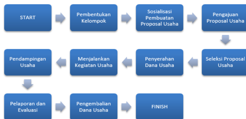
Gambar 2. Alur Pemberian Pembiayaan Mikro di Perguruan Tinggi

System yang dipakai adalah bagi hasil, sehingga tidak memberatkan bagi mahasiswa wirausaha