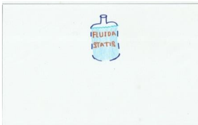
Gambar 1. Fluida Statis sebagai Pusat Topik Mind Map

Langkah-langkah pembuatan mind map yaitu menentukan pusat topik. Pusat mind map merupakan ide atau gagasan utama. Dalam meringkas atau mengkaji ulang, biasanya adalah judul bab atau tema pokok yang dipelajari dan diletakkan di tengah kertas serta diusahakan berbentuk gambar.