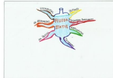
Gambar 2. Cabang Utama Mind Map Fluida Statis

selanjutnya setelah cabang utama (BOI). Contoh cabang utama mind map yang merupakan sub-bab dari fluida statis yaitu definisi, tegangan permukaan, kapilaritas, tekanan, hukum Pascal, hukum Archimedes, dan viskositas, dapat dilihat pada Gambar 2.