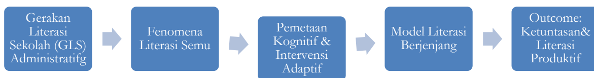
Gambar 2. Model konseptual Resolusi Literasi Semu melalui Intervensi Berjenjang

Penelitian ini juga menggeser paradigma evaluasi literasi yang selama ini cenderung bersifat administratif. Berbeda dengan pandangan (Nasution, 2024) yang menempatkan evaluasi sebagai alat ukur di sudut baca, penelitian ini memosisikan pemetaan literasi murni sebagai instrumen diagnostik berkelanjutan yang secara langsung memengaruhi intervensi harian. Jika penelitian (Hartini et al., 2023) hanya menekankan pada penyesuaian tahap perkembangan secara konseptual, studi ini memberikan wujud operasionalnya melalui struktur capaian yang terintegrasi. Hubungan antara masalah literasi semu dan resolusi melalui model literasi berjenjang ini divisualisasikan dalam model konseptual pada Gambar 1