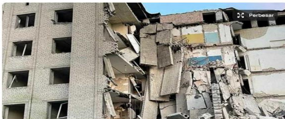
Rudal Rusia Hantam Desa di Polandia. 2 Orang Tewas. Reruntuhan apartemen di Donesk, Ukraina, yang terhantam rudal Rusia

Рисунок 6: Ложное сообщение о том, что Россия выпустила ракету по деревне в Польше.