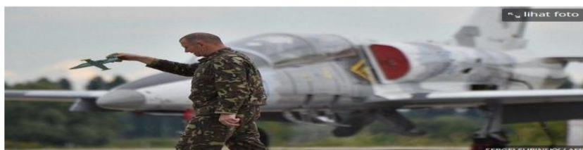
FOTO ILLUSTRASI: Seorang pilot pesawat tempur MiG-29 Ukraina berlatih terbang dengan model pesawat di pangkalan militer Angkatan Udara di kota kecil Vasykyv, sekitar 40 km dari Kiev pada 3 Agustus 2016.