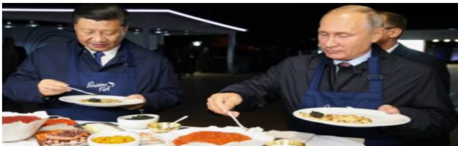
China secara terbuka akan memberikan bantuan makanan hingga militer ke Rusia

Susi Susanti, Okezone - Selasa 15 Maret 2022 12:05 WIB