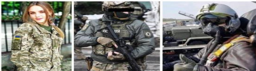
Рисунок 7: Разъяснение относительно ложных сообщений о киевских призраках, украинских жнецах и Наташе Перакове.

Penulis: Mona Kriesdinar | Editor: Mona Kriesdinar