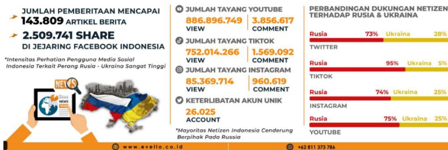
Рисунок 1. Конфликт между Россией и Украиной в Эвелло

Data Pemantauan di Youtube, Twitter, Instagram dan Tiktok. Periode: 23 Februari - 10 April 2022