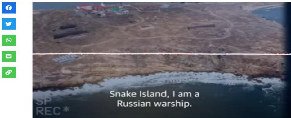
Pulau Ular di wilayah Ukraina, kini dikuasai Rusia.

Рисунок 10: Разъяснения относительно ложных сообщений о гибели 13 украинских солдат на Змеином острове.