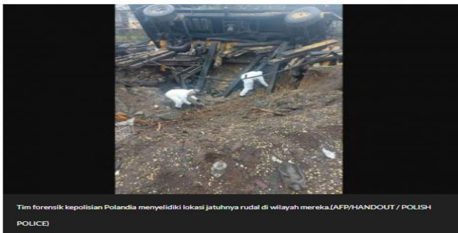
Рисунок 9: Разъяснение ложных сообщений об обвинениях в том, что Россия выпустила ракету по деревне в Польше.