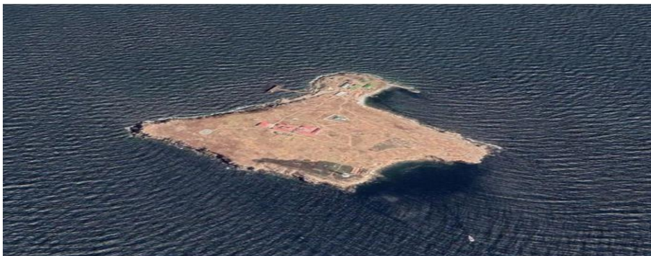
Рисунок 4: Ложное сообщение о гибели 13 украинских солдат на Змеином острове.