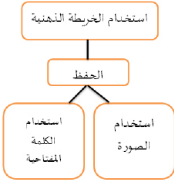
الشكل 2: إستراتيجيات الحفظ

بالصورة، كما أن الألفاظ المفتاحية قد أخذت من أوائل الكلمات لسهولة حفظها.