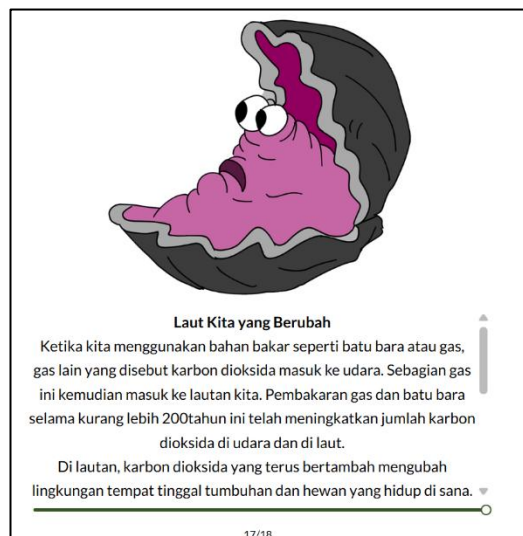
Gambar 7 Fakta Ilmiah dalam Narasi Cerita Laut yang Memanas

Cerita Laut yang Memanas juga mengedukasi pembaca muda tentang proses ilmiah dan dampak lingkungan secara sederhana namun efektif, seperti penjelasan tentang bagaimana karbondioksida yang berlebihan menyebabkan laut menjadi lebih asam dan menghambat pertumbuhan cangkang makhluk laut. Dengan demikian, cerita ini mengajak anak-anak untuk memahami isu perubahan iklim secara holistik dan menginternalisasi pentingnya menjaga kelestarian laut sebagai bagian dari tanggung jawab bersama. Pendekatan ini sejalan dengan prinsip ekokritik yang menekankan kesadaran ekologis dan kritik terhadap praktik manusia yang merusak alam, serta mendorong literatur sebagai media edukasi dan advokasi lingkungan