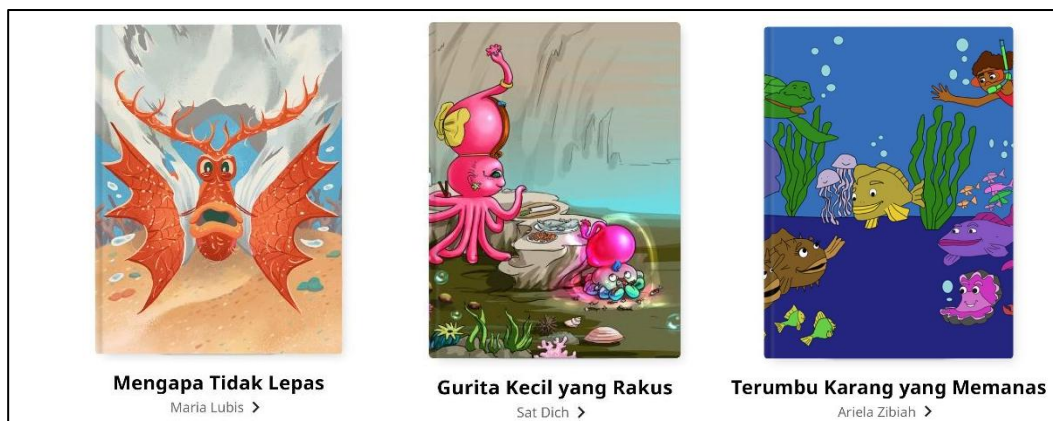
Gambar 1; Sampul Cerita Digital Mengapa Tidak Lepas, Gurita Kecil yang Rakus, dan Terumbu Karang yang Memanas di Aplikasi Let's Read

Secara umum, kebanyakan sastra anak menempatkan sudut pandang anak sebagai titik utama penceritaan (Nurgiyantoro, 2010). Namun dalam karya sastra yang menjadi objek penelitian ini, karakter "anak" tidak selalu dihadirkan dalam wujud anak-anak. Ketiga cerita yang menjadi objek penelitian ini menggunakan biota laut sebagai pembangun cerita. Pada cerita pertama, Mengapa Tidak Lepas, tokoh utama bernama Skorpi yang merupakan ikan lepu dari Ambon. Pada cerita kedua yang berjudul Gurita Kecil yang Rakus mengangkat tokoh bernama Nina yang berjenis gurita, sementara pada cerita terakhir berjudul Terumbu Karang yang Memanas mengisahkan kondisi ikan-ikan di laut yang lemah dan mengalami perubahan perilaku akibat pemanasan global.