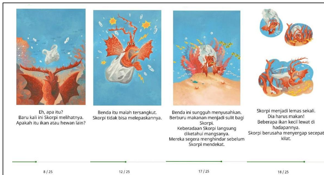
Gambar 2 Tokoh Skorpi dalam Cerita Mengapa Tidak Lepas Kesulitan Bergerak Akibat Tersangkut Kantong Plastik yang Mencemari Lautan

Ekokritik mencoba untuk mengeksplorasi bagaimana karya sastra dapat berfungsi sebagai alat untuk membangkitkan kesadaran ekologis dan menyampaikan pesan-pesan pelestarian alam. Pada kutipan cerita dalam gambar di atas misalnya, dapat dilihat bahwa alam telah dicemari oleh manusia. Alam yang harusnya menjadi tempat nyaman sekaligus aman, berubah menjadi ruang paling mengancam bagi penghuninya. Tokoh Skorpi dalam cerita Mengapa Tidak Lepas menjadi salah satu gambaran makhluk hidup yang mendapat nasib sial akibat ulah manusia yang apatis terhadap lingkungan. Benda-benda asing seperti kaleng atau kantong plastik tidak diproduksi dari alam atau tidak terbentuk secara alami. Organisme alam pun tidak mengenal senyawa benda-benda anorganik ini (Utami, 2022). Itulah sebabnya kaleng, plastik, atau benda-benda anorganik tidak bisa terurai atau rusak bahkan setelah lebih dari 20 tahun berada dalam laut (Tempo, 2020).