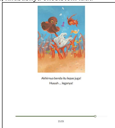
Gambar 5 Kantong Plastik yang Sulit Terurai dan Menjadi Sampah Laut

Cerita Mengapa Tidak Lepas menampilkan tema utama tentang keterkaitan dan ketergantungan antar makhluk hidup dalam ekosistem laut. Melalui narasi yang menggambarkan interaksi antara berbagai hewan laut seperti Skorpi, alga, dan makhluk lainnya, cerita ini menyoroti betapa rapuh dan kompleksnya keseimbangan ekosistem bawah laut. Mengapa Tidak Lepas juga mengkritik dampak negatif aktivitas manusia yang mengganggu keseimbangan alam, khususnya ekosistem laut.