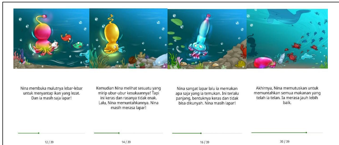
Gambar 3 Tokoh Nina dalam Cerita Gurita Kecil yang Rakus Saat Memakan Sampah-Sampah Plastik yang Mencemari Lautan

Pendekatan ekokritik dalam sastra anak sangat relevan untuk menganalisis cerita ini karena ekokritik berfokus pada hubungan antara sastra dan lingkungan hidup. Melalui cerita yang sederhana dan mudah dipahami, Gurita Kecil yang Rakus mengajak pembaca muda untuk mengenal dan memahami isu-isu lingkungan, khususnya pencemaran laut yang menjadi masalah global. Di Indonesia, pencemaran laut menjadi masalah yang serius. Tercatat sekitar 3,2 juta ton sampah plastik diproduksi setiap tahun dan sebagian besarnya berakhir di laut (Antoni, 2025). Melihat hal ini, dapat disimpulkan bahwa sastra anak tidak hanya berfungsi sebagai media hiburan, tetapi juga sebagai alat edukasi yang efektif untuk menanamkan kesadaran ekologis sejak dini. Dengan cara ini, anak-anak dapat belajar tentang pentingnya menjaga kelestarian alam dan bertanggung jawab terhadap lingkungan khususnya laut.