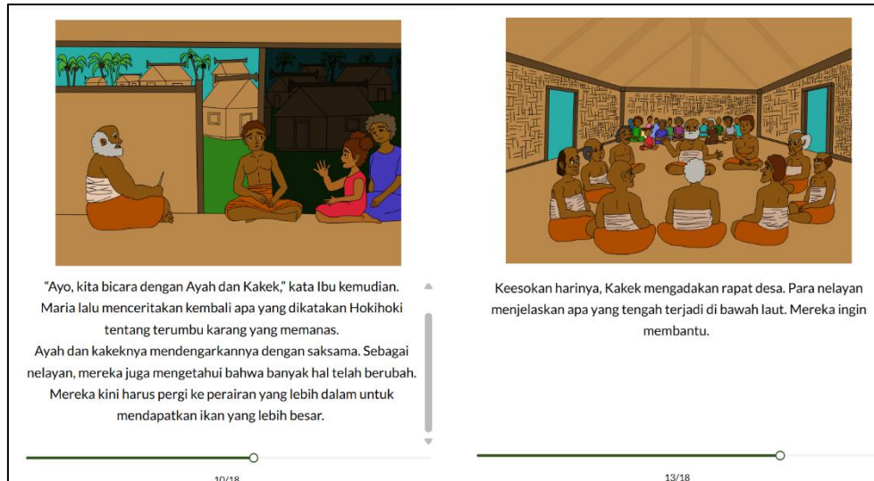
Gambar 7 Para Nelayan Bersepakat untuk Tidak Mengganggu Terumbu Karang Lagi

Cerita Laut yang Memanas juga mengedukasi pembaca muda tentang proses ilmiah dan dampak lingkungan secara sederhana namun efektif, seperti penjelasan tentang bagaimana karbondioksida yang berlebihan menyebabkan laut menjadi lebih asam dan menghambat pertumbuhan cangkang makhluk laut. Dengan demikian, cerita ini mengajak anak-anak untuk memahami isu perubahan iklim secara holistik dan menginternalisasi pentingnya menjaga kelestarian laut sebagai bagian dari tanggung jawab bersama. Pendekatan ini sejalan dengan prinsip ekokritik yang menekankan kesadaran ekologis dan kritik terhadap praktik manusia yang merusak alam, serta mendorong literatur sebagai media edukasi dan advokasi lingkungan