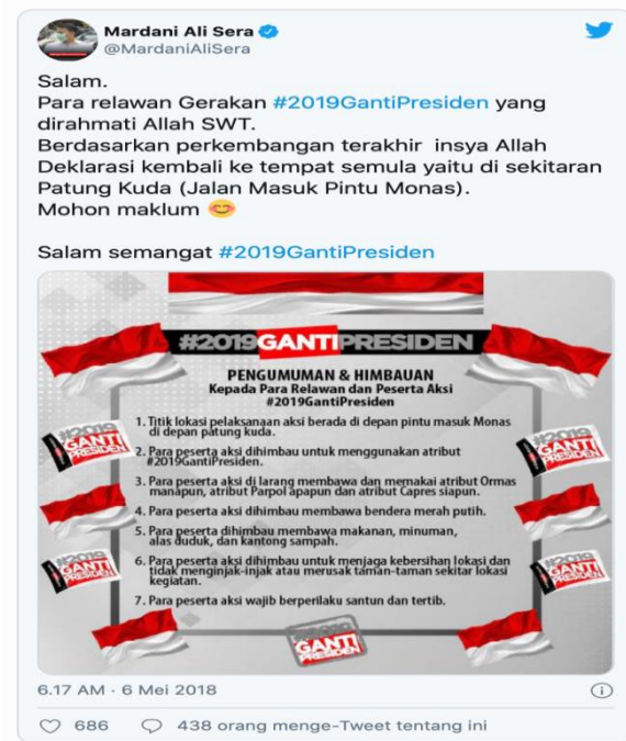
Gambar Twit akun @MardaniAliSera

dibicarakan. Tagar itu pertama kali digagas @MardaniAliSera, akun twitter milik politikus PKS (Partai Keadilan Sejahtera) Dr. Mardani Ali Sera beserta kelompoknya (Hadi, Siaful. Tempo. 2018). 12 Drone Emprit, peranti lunak analisis percakapan di media sosial mengatakan sejak tagar tersebut dibuat mulai 1 April sampai 10 April 2018. Drone Emprit mencatat terdapat 110 ribu mention tentang tagar #2019GantiPresiden. Bahkan reaksi masyarakat di media sosial membuat tagar tersebut mengalami peningkatan hingga 300 persen pada 8 April 2018, yakni dari 7 ribu mention perhari menjadi 37 ribu perhari (Vivanews.co.id. 2018). 13